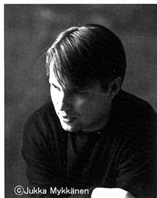
指揮 ピエタリ・インキネン [首席客演指揮者]

2011年4月の横浜定期演奏会は、インキネンによるオール・フレンチプログラムとして注目されていましたが、フィンランド大使館の判断によりインキネンの来日が不可能となり、急遽広上淳一氏が指揮台に立ちました。3年半の時を経て、ついに同プログラム公演の実現です(ピアノ協奏曲のみラヴェル「左手のための協奏曲」に変更)。絶妙なサウンド感覚をもつインキネンが、ドビュッシー、ラヴェルというフランス音楽のエッセンスを日本フィルから引き出してくれることでしょう。共演は、1964年からフィンランドに本拠地を置くピアニスト館野泉。フィンランドの魂を共有する2人の、シンパシーに満ちた共演にご期待ください。