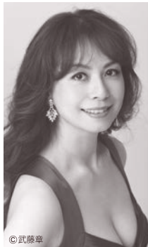
ピアノ：三船 優子 Yuko Mifune

幼少期を日本で過ごしヴァイオリンを風岡裕氏に学ぶ。12歳で渡欧しウィーン市立音楽院にてヴァイオリンをワルター・バリリ、その後ジュリアード音楽院でドロシー・ディレイらに学んだ後に指揮に転向。1992年より小澤征爾らに師事し、マネス音楽院にて楽曲分析及び作曲法を学ぶ。その後タンゲルウッド音楽祭においてサイモン・ラトルらに師事。1995年、ニコライ・マルコ国際指揮者コンクールで4位入賞。1996～1998年には、ボストン交響楽団とニューヨーク・フィルの定期演奏会、及びタンゲルウッド音楽祭にて小澤征爾、サイモン・ラトル、ベルナルド・ハイティンクラの副指揮者を務めた。1999～2007年、ニューヨーク州カユウガ室内管弦楽団の音楽監督、2006～2008年、ベルリン・コーミッシェ・オーバーの首席カペルマイスター、2007～2012年6月までテキサス州アマリコ交響楽団音楽監督、2009年～2013年まで大阪交響楽団首席客演指揮者として活躍。現在、2010年12月よりドイツ・マゲデブルグ劇場音楽監督を務めている。2010年「第9回斎藤秀雄メモリアル基金賞」指揮者部門受賞。賞金は、次世代の音楽家育成に貢献したいという当人の意向により、ジュニア・フィルハーモニック・オーケストラに全額寄付された。