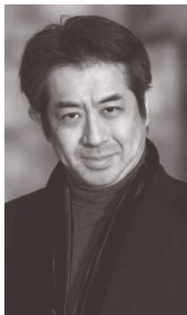
指揮：キンボー・イシイ Kimbo Ishii

幼少期を日本で過ごしヴァイオリンを風岡裕氏に学ぶ。12歳で渡欧しウィーン市立音楽院にてヴァイオリンをワルター・バリリ、その後ジュリアード音楽院でドロシー・ディレイらに学んだ後に指揮に転向。1992年より小澤征爾らに師事し、マネス音楽院にて楽曲分析及び作曲法を学ぶ。その後タンゲルウッド音楽祭においてサイモン・ラトルらに師事。1995年、ニコライ・マルコ国際指揮者コンクールで4位入賞。1996～1998年には、ボストン交響楽団とニューヨーク・フィルの定期演奏会、及びタンゲルウッド音楽祭にて小澤征爾、サイモン・ラトル、ベルナルド・ハイティンクラの副指揮者を務めた。1999～2007年、ニューヨーク州カユウガ室内管弦楽団の音楽監督、2006～2008年、ベルリン・コーミッシェ・オーバーの首席カペルマイスター、2007～2012年6月までテキサス州アマリコ交響楽団音楽監督、2009年～2013年まで大阪交響楽団首席客演指揮者として活躍。現在、2010年12月よりドイツ・マゲデブルグ劇場音楽監督を務めている。2010年「第9回斎藤秀雄メモリアル基金賞」指揮者部門受賞。賞金は、次世代の音楽家育成に貢献したいという当人の意向により、ジュニア・フィルハーモニック・オーケストラに全額寄付された。