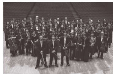
神奈川フィルハーモニー管弦楽団

1970年3月に発足、神奈川県音楽文化創造をミッションに活発な活動を続けている。年間の演奏回数は実に280回を数える(2012年度実績)。2014年4月、自治体、企業、個人から合計4億6千万円もの寄付を賜り、公益財団法人への移行を果たした。国内最年少常任指揮者の川瀬賢太郎、特別客演指揮者の小泉和裕、首席客演指揮者のサッシャ・ゲッツェルの三指揮者体制による芸術面での更なる飛躍が期待されている。演奏活動の中心である定期演奏会は2014年度に300回を迎え、楽団の総力を結集した内容で好評を博している他、県内各地で特色ある演奏会を多数開催し、オーケストラの啓蒙・普及に努めている。青少年への音楽教育事業を活動の重要な柱として、毎年100回以上の公演を開催している。