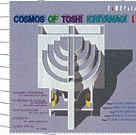
バガニーニ・パーソナル 一柳慧の宇宙 I CMCD-50037