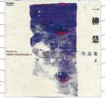
一柳慧 作品集 4 FOCD3497