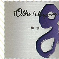
一柳慧 「ピアノ音楽第4」ほか NYNG-011