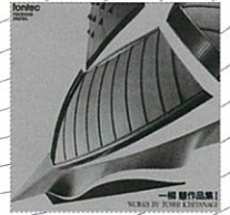
一柳慧 作品集 1 FOCD3126