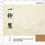
一柳慧 作品集 CMCD-99046