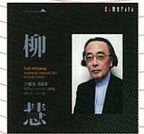
交響曲第8番 リヴェレーション2011 CMCD-28257