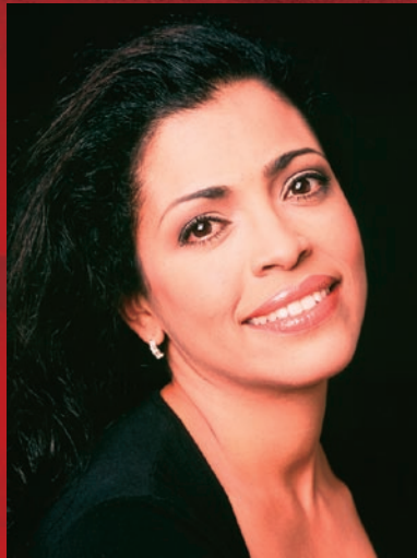
メルバ・ラモス [ソプラノ]