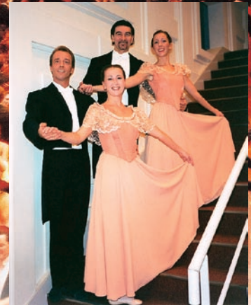
ウィーン・ フォルクスオーパー・バレエ