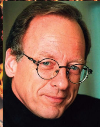
ウヴェ・タイマー [指揮]